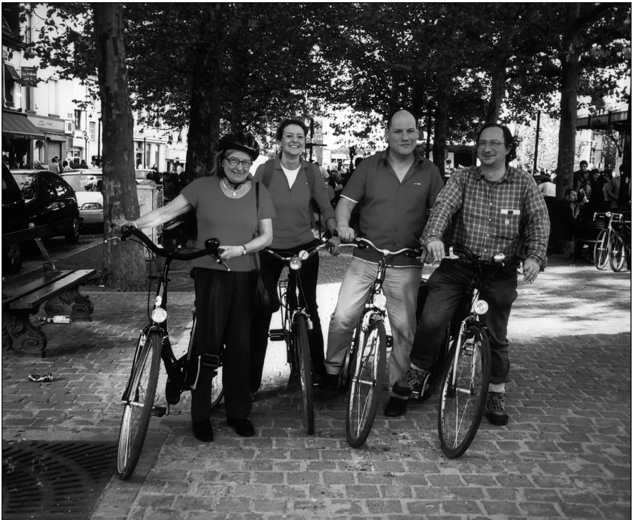
De "dernier carré" van de kunstgalerijenfietsocht op 15 mei 2004 (oude graanmarkt)

Zomersouper - Bezoek aan het Museum Felix De Boeck en aan de tentoonstelling Helène Riedel .